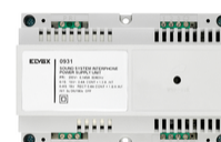
0931 - Τροφοδ. συστ. θυροτηλ. Sound System 230V