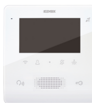
7559 - Θυροτηλεόραση Tab Free 4,3 2F+ λευκή