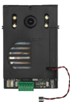
40135 - Μονάδα Ήχου / βίντεο 2F+