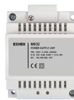
M832 - Μετασχηματιστής 230V 12Vac 35W