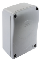
ECA5.W - Wi-Fi control card 24V swing gate