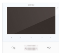
40505 - Tab 7 2F+ hands- free video entryph.white