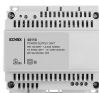
40110 - Τροφοδοτικό 2F+ 100-240V 1 OUT 1,6A