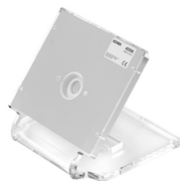
40596 - Βάση τραπέζιου Tab 7 Up