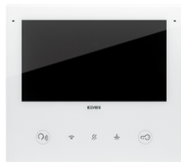
40517 - Ενδοεπικοινωνία βίντεο 2F+ Wi-Fi Tab7SUp