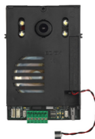
40135 - Μονάδα Ήχου / βίντεο 2F+