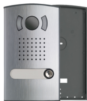
40151 - Audio/Video color entrance panel 1Fam.