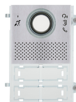
41105.01 - Εμπρόσθια πλάκα A/V Pixel Teleloop γκρι