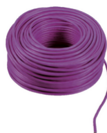
732I.C.100 - 2F+ καλώδιο 2x1 LSZH Csa 100m βιολέτα