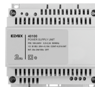
40100 - Τροφοδοσία Θυροτηλέφωνο 2F+ 100-240V0,6A