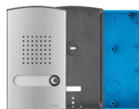
40141 - 1-family audio entrance panel