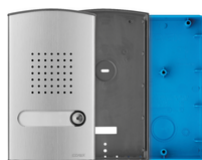
40141 - 1-family audio entrance panel