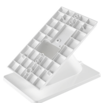
40598 - Βάση τραπεζιού Voxie λευκό