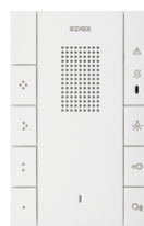
40547 - Θυροτηλέφωνο Voxie 2F+ 7 κουμπιά λευκό