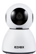
46239.040A - Κάμερα PT Wi- Fi Full-HD 1080p 4mm