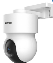
46241.030B - Κάμερα Wi-Fi PT 1080p - 3mm υπαίθριος