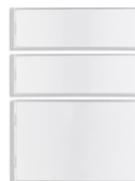
42920.K - Κιτ κουμπιών 1-2- 4 για πλάκα κιτ βίντεο