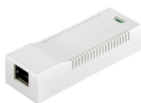
40168 - Μετατροπέας IP/2- wire για έκκεντρα