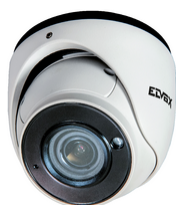
4622.2812BA - Κάμερα Dome IR IP 2Mpx 2,8-12mm Mic A.V.