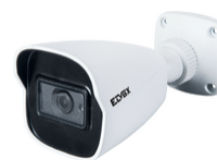
4621.2812BA - Κάμερα Bullet IP IR 2Mpx 2,8-12mm A.V.