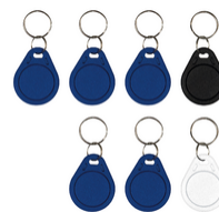
40169 - 7 κλειδιά RFID Mifare