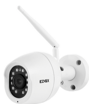
46237.040A - Κάμερα Bullet Wi-Fi Full-HD 1080p 4mm