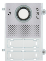
41105.01 - Εμπρόσθια πλάκα A/V Pixel Teleloop γκρι