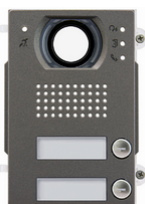
41272 - Εμπρός mod.teleloop A/V 2PIK10IP54 Heavy