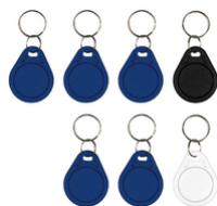
40169 - 7 κλειδιά RFID Mifare