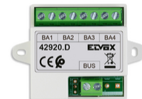
42920.D - Διανομέας λεωφορείου 4 εξόδου κιτ βίντεο