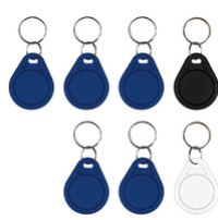
40169 - 7 κλειδιά RFID Mifare