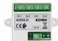
42920.D - Διανομέας λεωφορείου 4 εξόδου κιτ βίντεο