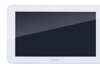
Κ42937 - Πρόσθετο τροφοδοτικό DIN οθόνης 7inTS