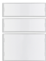
42920.K - Κιτ κουμπιών 1-2-4 για πλάκα κιτ βίντεο