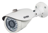
46CAM.136B.8 - Κάμ. Bullet IR AHD 1080p φακ. 3,6mm CVBS