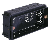
V71305.AU - Κουτί χωνευτό 5M μαύρο