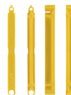
V71563 - Συνδέτης κουτιών χωνευτών κί