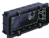
V71306.AU - Κουτί χωνευτό 6-7M μαύρο