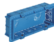
V71306 - Κουτί χωνευτό 6-7M θαλασσί