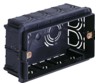
V71304.AU - Κουτί χωνευτό 4M μαύρο