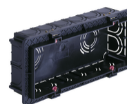
V71306.AU - Κουτί χωνευτό 6-7M μαύρο