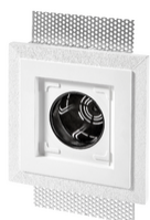
V71791 - Κουτί 2M για πλάκα Exé