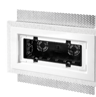
V71796 - Κουτί 7M για πλάκα Exé