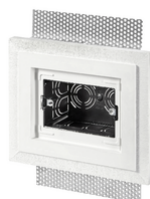
V71793 - Κουτί 3M για πλάκα Exé