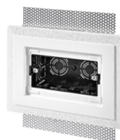
V71794 - Κουτί 4M για πλάκα Exé