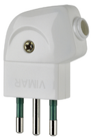
00211.B - Clavija 2P+T 10A S11 90° blanco