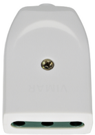
00222.B - Toma 2P+T 16A P17 axial blanco