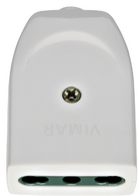
00223.B - Toma 2P+T 16A P1711 axial blanco