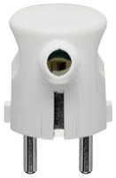
00241.B - Clavija 2P+T 16A S31 90° blanco