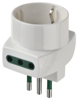
00322.B - Adaptador múlt. S11+2P11+P30 blanco