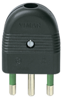
01026 - Clavija 2P+T 16A axial negro