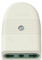
01029.B - Toma 2P+T 16A P17/11 axial blanco