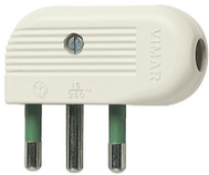
01043.B - Clavija 2P+T 16A 90° blanco