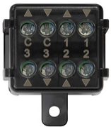
03997 - Módulo persianas Quid