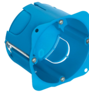
V71701 - Caja emp.redonda p/paredes huecas azul