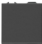
09013.2.CM - Interr.cruzado 1P 16AX 2M carbon matt