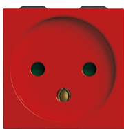
09240.R - Toma SICURY 2P+T 16A israelí rojo