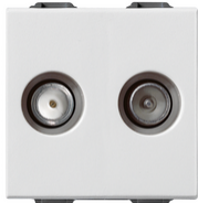
09302.01 - Toma TV-RD-SAT directa 2salidas blanco