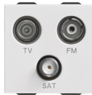
09303 - Toma TV-FM-SAT directa 3salidas blanco