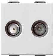
09302.01 - Toma TV-RD-SAT directa 2salidas blanco