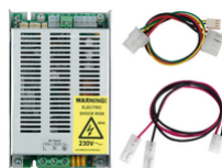
03805 - By-alarm Plus alimentador 230V13Vdc3,2A