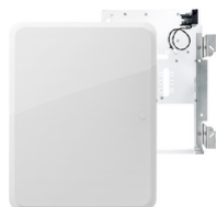
03816 - By-alarm Plus adaptador centralita 24M