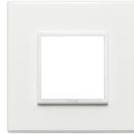
21642.17 - Placa 2M aluminio blanco total