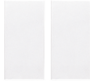
20506.B - Tecla 1M para mando RF blanco - 2 piezas