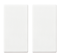
14506 - Tecla 1M para mando RF blanco - 2 piezas