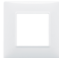
14642.01 - Placa 2M tecn. blanco