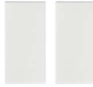
19506.B - Tecla 1M para mando RF blanco - 2 piezas