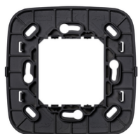
19507.RN - Soporte mando RF placa Round gris