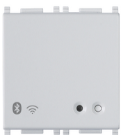
14597.SL - Gateway conectado IoT 2M Silver