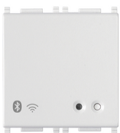
14597 - Gateway conectado IoT 2M blanco