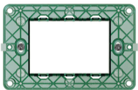
14613 - Soporte 3M con tornillos