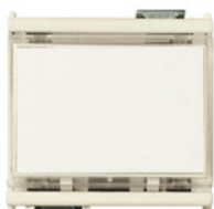
08420 - Pulsador 1P NO 10A 14050 - Pulsador plaquita 1P 19050 - Pulsador plaquita 1P 19050.B - Pulsador plaquita 1P NO 10A blanco