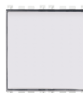
19050.B - Pulsador plaquita 1P NO 10A blanco