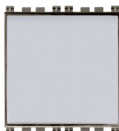
19050.M - Pulsador plaquita 20050 - Pulsador plaquita 1P 20050.B - Pulsador plaquita 20050.N - Pulsador plaquita 1P NO 10A Metal