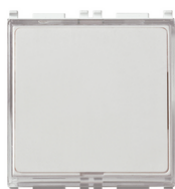
NO 10A 250V blanco