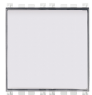
19050.M - Pulsador plaquita 20050 - Pulsador plaquita 1P 20050.B - Pulsador plaquita 20050.N - Pulsador plaquita 1P NO 10A Next