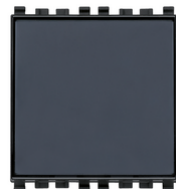
NO 10A gris