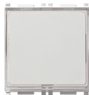
NO 10A 250V blanco