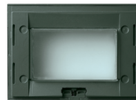
16813.Q - Soporte IP55 3M gris