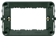
16713 - Soporte 3M con tornillos