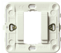
17080.B - Soporte 1M liso con garras blanco