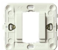
17080.B - Soporte 1M liso con garras blanco