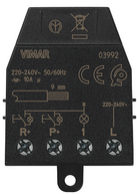
03992 - Quid - Módulo relé impulsos 10A+reset