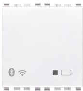
20597.B - Gateway conectado IoT 2M blanco