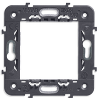
21603 - Soporte 2M sin tornillos eje 71